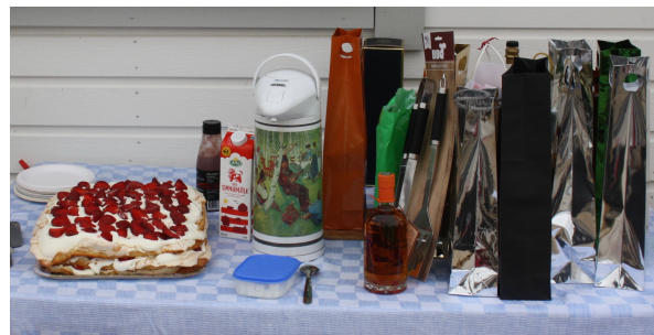
Marängtårta och prisbord...

svenska språket så fick Smirre lite vodka – Zubrowka (ni vet den där med ett grässtrå i). Så Smirre, nästa gång kan du ge dig på att jag har rostfritt!